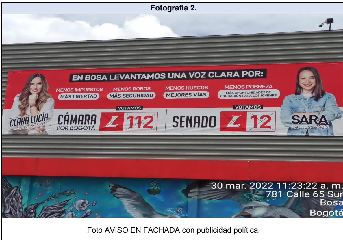
Foto AVISO EN FACHADA con publicidad política.